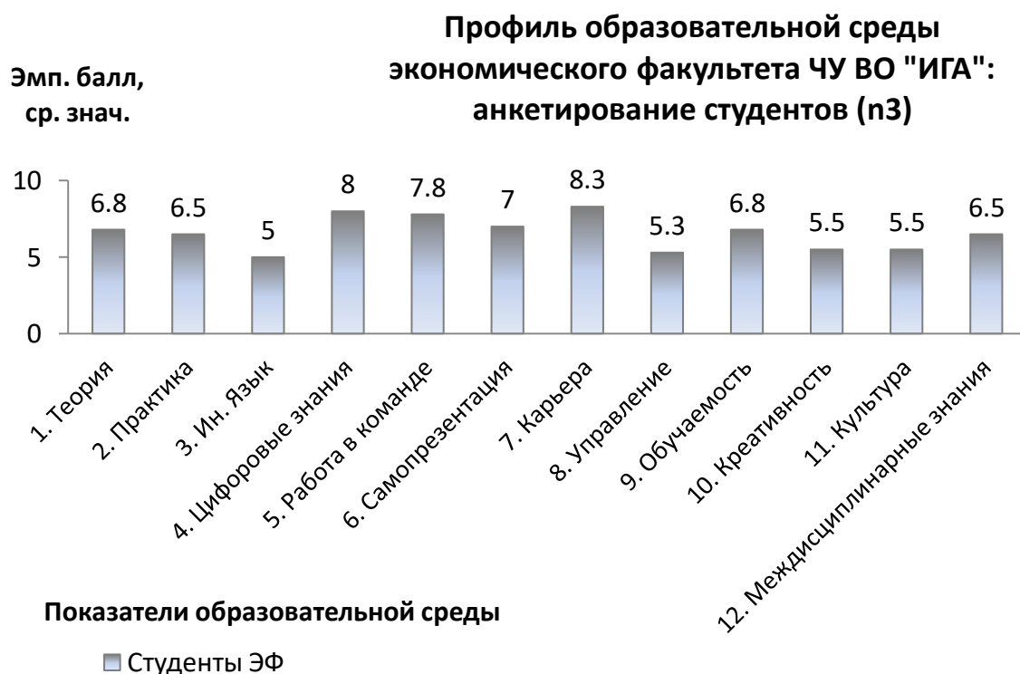
Рис. 1.3. Результаты анкетирования студентов: профиль образовательной среды Экономического факультета ЧУ ВО «ИГА»

Как показано ниже, на рис. 3, в профиле образовательной среды экономического факультета ЧУ ВО «ИГА», построенном по результатам анкетирования студентов, «пиковые» значения отмечаются по трём показателям: «Карьера», «Цифровые знания», «Работа в команде». По этим показателям студенты оценивают образовательную среду Института высоко (выше среднего).