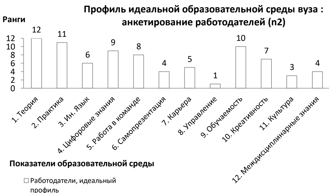
Рис. 1-а. Результаты анкетирования работодателей: профиль идеальной образовательной среды вуза