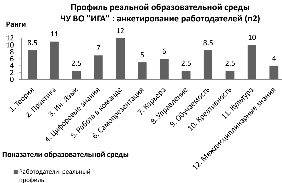
Рис. 1-б. Результаты анкетирования работодателей: профиль реальной образовательной среды ЧУ ВО «ИГА»

Две гистограммы представляют собой, соответственно, идеальный («прозрачный») и реальный («тёмный») профили образовательной среды Института.