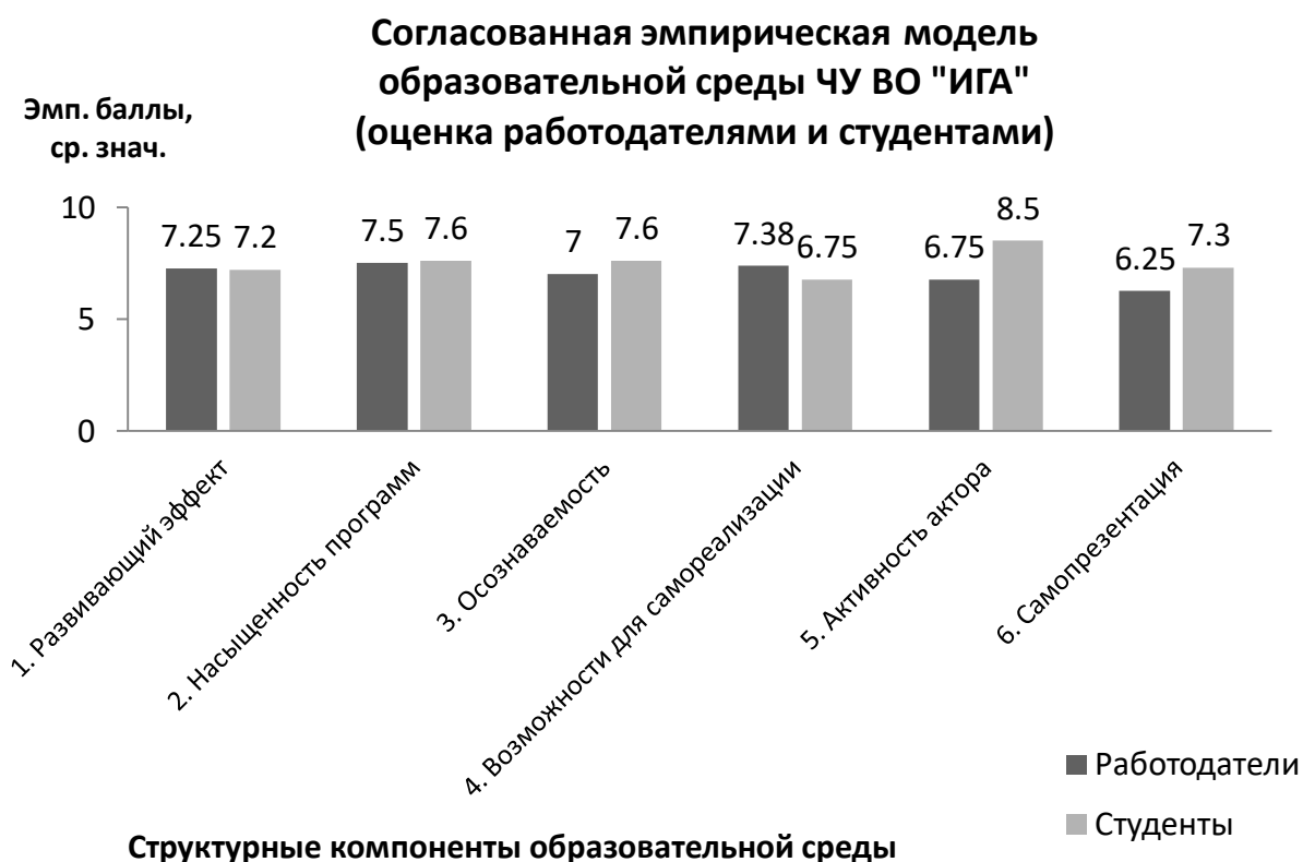
Рис. 2 Согласованная эмпирическая модель образовательной среды ЧУ ВО "ИГА" (оценка работодателями и студентами)

Как показано на рис.2, студенты оценивают образовательную среду ЧУ ВО «ИГА» в целом выше, чем работодатели (по 4-м из 6-и компонентов). К выявленным компонентам относятся (по значимости расхождений): «Активность актора», «Самопрезентация», «Осознанность», «Насыщенность программ».