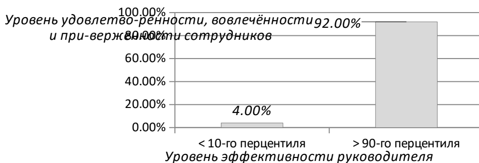
Рис. 3.1. Влияние руководителя на удовлетворённость, вовлечённость и приверженность сотрудников (оценка по методике 360°, N=2865). 2

«Какой фактор сильнее всего влияет на вашу удовлетворённость, вовлечённость и приверженность работе? ... это — ваш непосредственный руководитель. Рассмотрим, например, результаты нашего недавнего исследования эффективности 2 865 руководителей в большой финансовой компании (рис. 3.1). Вы можете видеть сильную корреляцию между вовлечённостью сотрудников и уровнем общей эффективности их руководителей (который был оценен не только их подчинёнными, но и их руководителями, коллегами и другими сотрудниками, принявшими участие в оценке 360°). ... в левой части графика показатели удовлетворённости, вовлечённости и приверженности сотрудников, находящихся под худшими руководителями (теми, кто ниже 10-го перцентиля), достигли только 4-го перцентиля. Это означает, что 96% сотрудников компании были более привержены работе, чем эти несчастные. В правой части графика вы видите лучших лидеров (выше 90-го перцентиля), которые руководили самыми счастливыми, вовлечёнными и приверженными сотрудниками — более счастливыми, чем 92% их коллег.